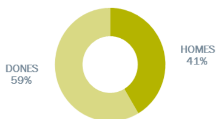
ATUR PER SEXE